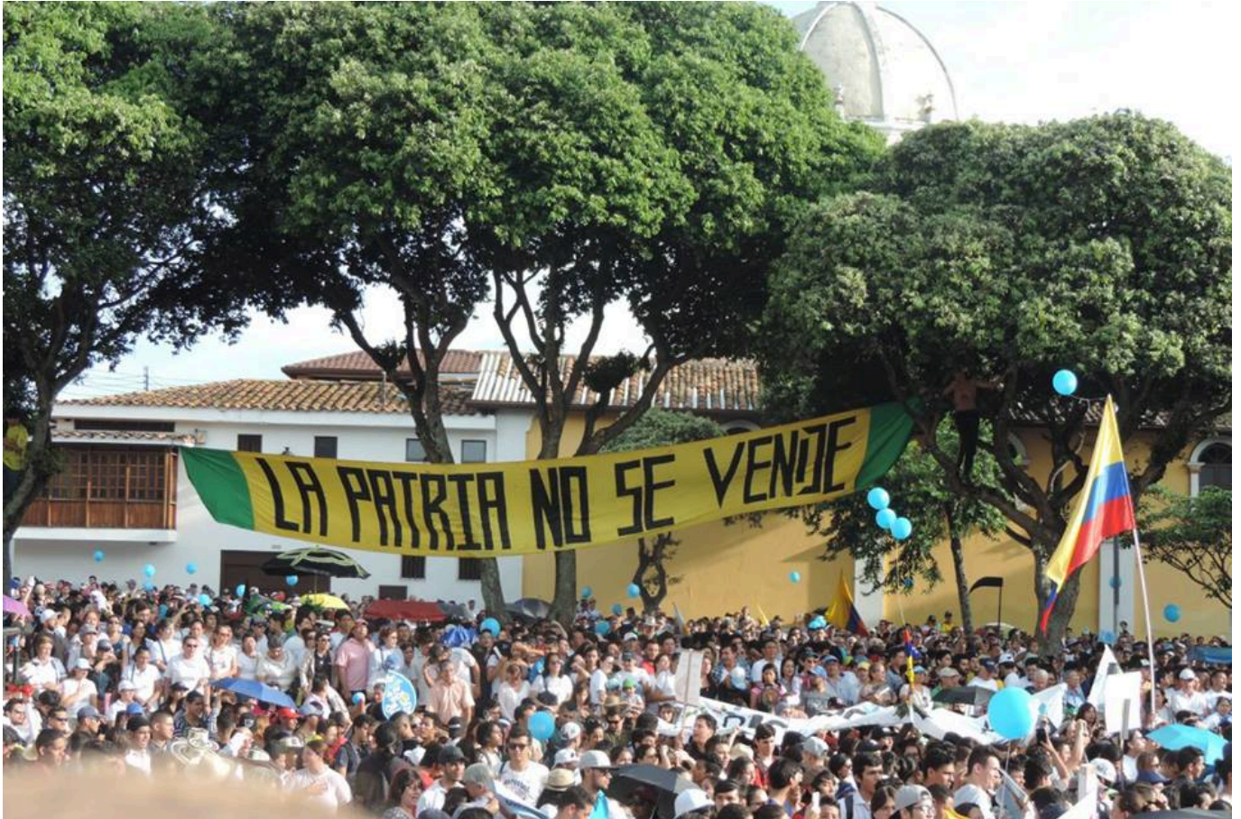
Plaza Luis Carlos Galán, Bucaramanga, Marcha Nuestro Oro es el agua.

En el momento actual la situación en la región es de expectativa por parte de las grandes empresas mineras con títulos mineros en proceso de exploración. Así, permanecen 7 multinacionales al acecho del páramo de Santurbán: Eco oro Minerals Corp, Sociedad Minera Calvista, Anglo Gold Ashanti, Leyhat, Galdway Resources Holdco, Red Eagle y Minesa, anteriormente AUX GOLD.